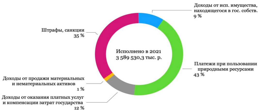
Структура неналоговых доходов областного бюджета в 2021 г.

Следует отметить, что по ряду налоговых и неналоговых доходов в период 2021 года отмечается перевыполнение плановых показателей по доходам, при этом корректировка плановых показателей не осуществлялась.