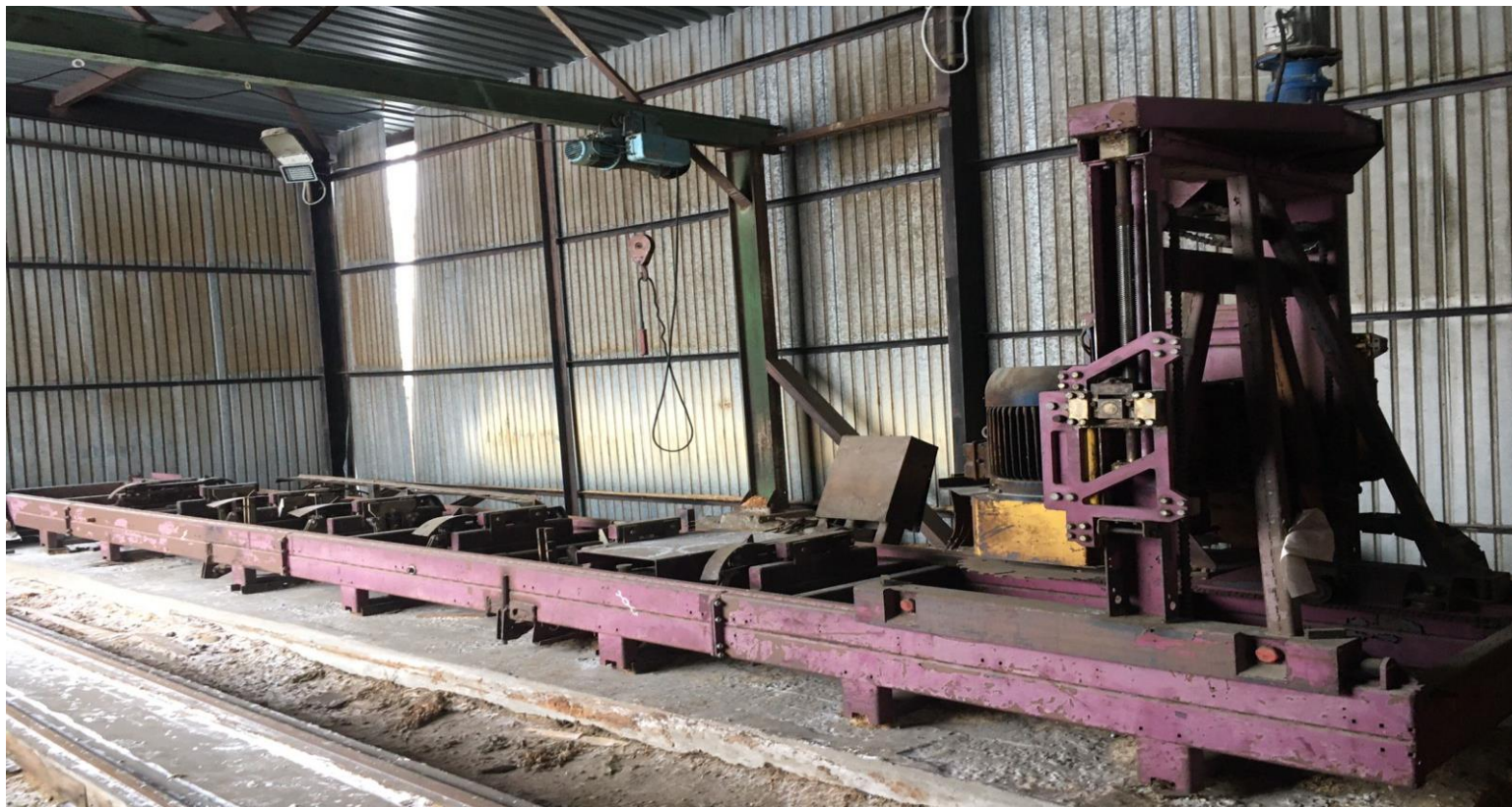
Движимое имущество (станок продольно-распилочный, двухдисковый «БАРС-ДГ»)