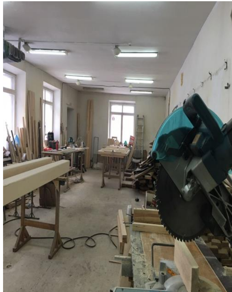
Нежилое одноэтажное благоустроенное здание