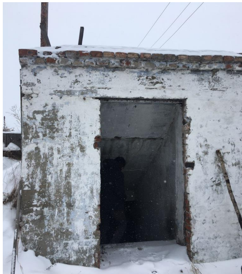
Вспомогательные сооружения (будка для собаки, деревянный сарай и подвал)