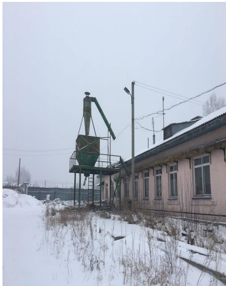
Вспомогательные сооружения (склад-навес, элеватор для опилок, забор)