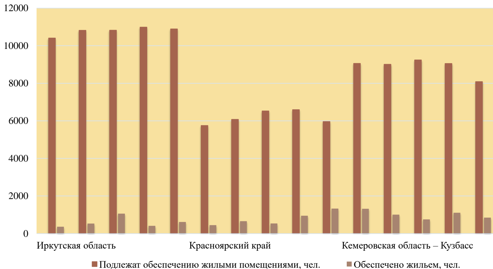
Динамика изменения очереди за 2019-2023 годы